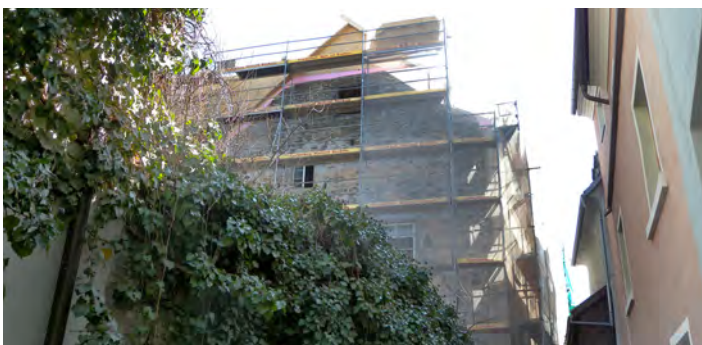
Mit der Fertigstellung des Projektes „Neustadt 14“ ist bereits Ende Oktober dieses Jahres zu rechnen.