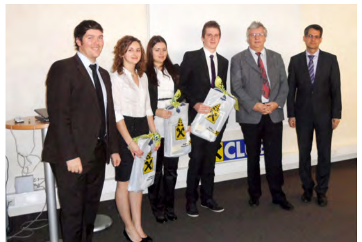
Erfolgreiche Schülerinnen und Schüler der HAK Feldkirch

Am 11. März fanden die Präsentationen zum diesjährigen TOPSIM General Management II in der Raiffeisenbank Feldkirch statt. Die vier Gruppen, welche sich in einer klasseninternen Qualifikation durchsetzen konnten, präsentierten ihre Geschäftsberichte zu den vergangenen Perioden. Als Belohnung gab es Sachpreise und Kinotickets. Die zwei besten Teams durften die BHAK Feldkirch am landesweiten Wettbewerb in Bregenz vertreten. Wir gratulieren allen Teilnehmern und freuen uns auf die Berichte für 2012.