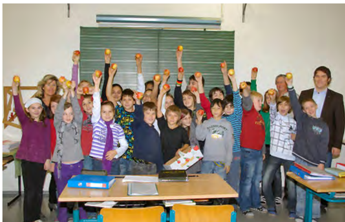
Die Schulkinder freuen sich über ihre Äpfel.